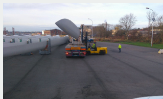
Projets auxquels les élèves ont participé section CTRM