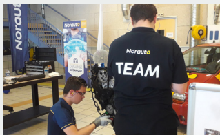
Projets auxquels les élèves ont participé section Voitures Particulieres