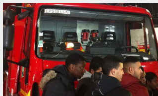
Projets auxquels les élèves ont participé section Véhicules de Transport Routier